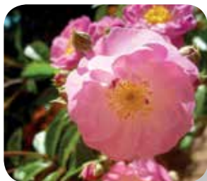
Une obtention de la pépinière Roses de Charme

Pour fêter nos 20 ans , nous baptiserons officiellement le rosier "Plantes Rares et Jardin Naturel ® " rendez-vous à l'accueil Samedi 14 avril à 11h